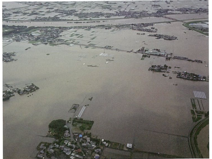
「令和2年7月豪雨」では、管内各地で冠水被害が発生した 【写真:大刀洗町 大堰小学校付近】