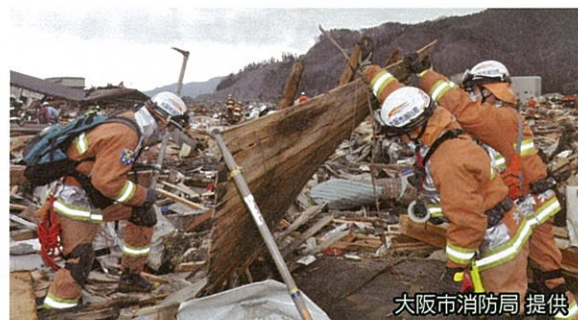
応援隊による要救助者の検索活動