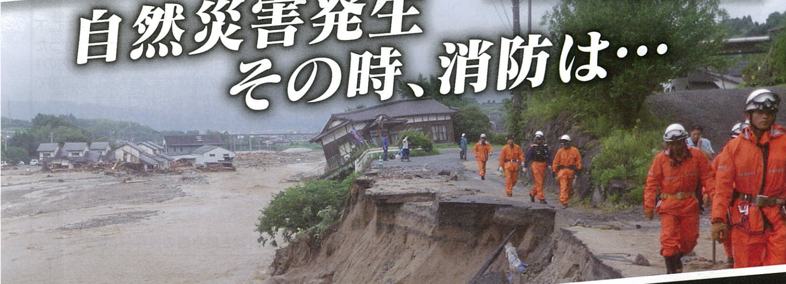
車両で進入できない現場へ救出に向かう (平成29年7月九州北部豪雨)