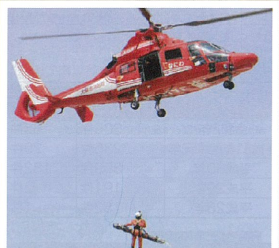
消防ヘリでの救助活動