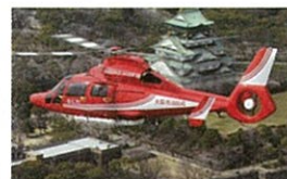
消防ヘリも被災地へ