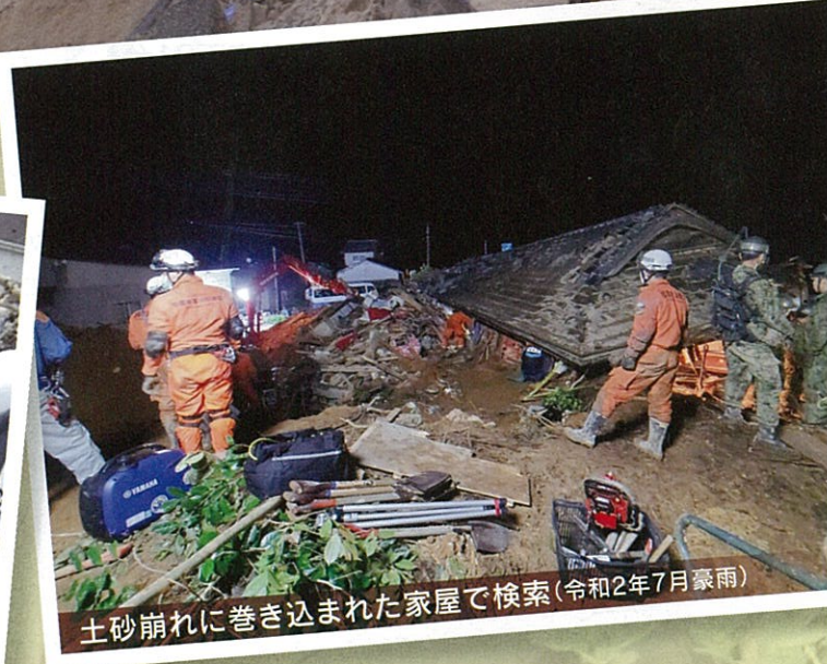
土砂崩れに巻き込まれた家屋で検索(令和2年7月豪雨)