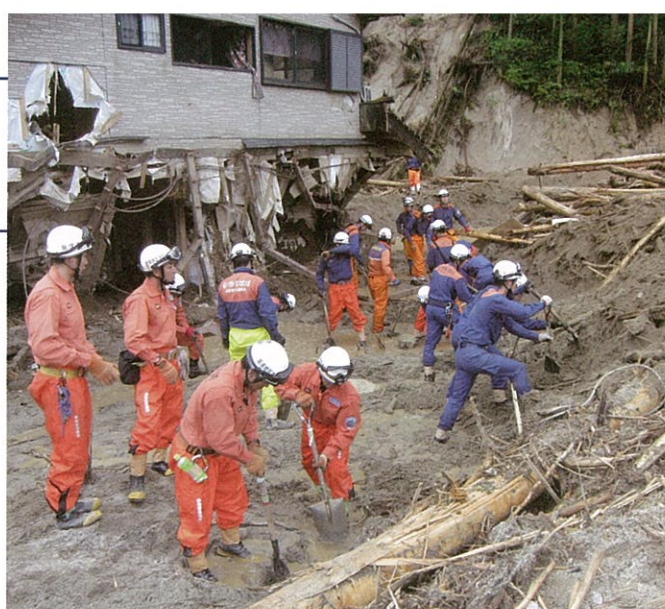
「平成29年7月九州北部豪雨」当消防本部から朝倉市へ応援出動

当消防本部では、令和2年4月時点で指揮隊や救助隊、救急隊など16隊を登録しており、これまでに「東日本大震災」(宮城県)や「熊本地震」(熊本県)、「平成30年7月豪雨」(広島県)、「令和2年7月豪雨」(熊本県)に応援出動しました。