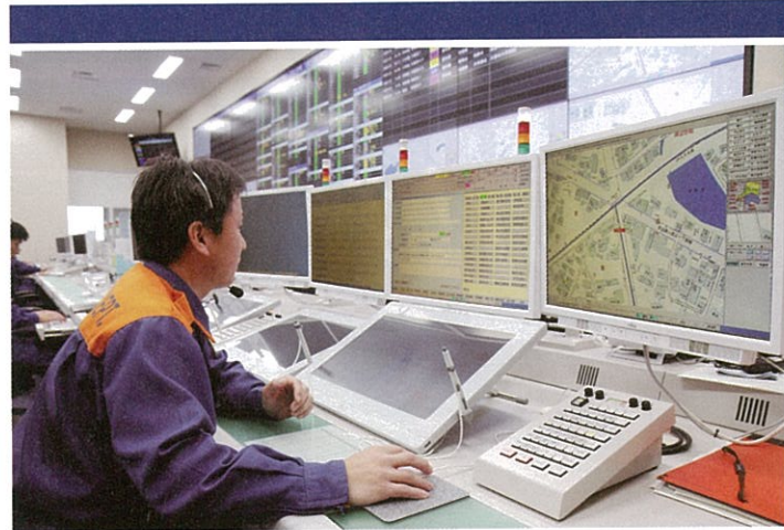
通報内容を聴取し、出動隊を選定する指令センター員