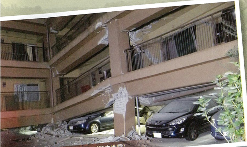
地震で倒壊したマンション(熊本地震)