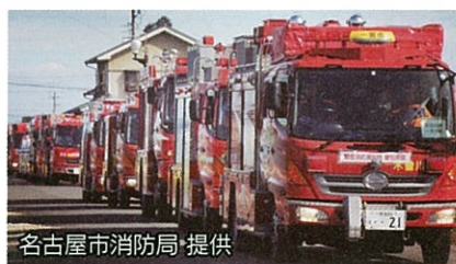
応援隊が被災地に向けて出動

緊急消防援助隊は、全国の消防機関による応援を速やかに実施するため、阪神・淡路大震災を教訓に平成7年6月に創設されました。令和2年4月時点における全国の登録数は、723消防本部6,441隊です。