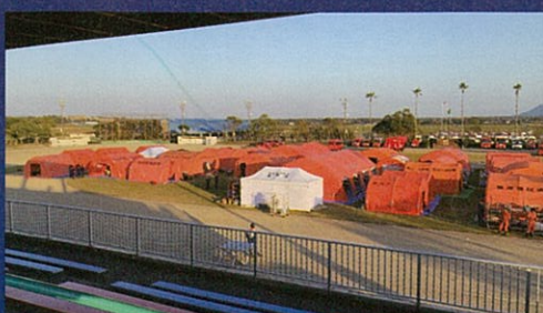
運動広場に設営された活動拠点

私は、これまで緊急消防援助隊として2度出動しました。「熊本地震」では、救助隊として出動。助けを求めている人のためにという使命感を胸に活動を開始しました。逃げ遅れた人がいないか検索活動を行いました。余震が続いていることもあり、活動が思うように進められず悔しい思いをしました。幸いにも私たちが活動した地域では逃げ遅れた人はいませんでしたが、活動を通して改めて自然の脅威を感じ、更なるレベルアップが必要だと痛感しました。