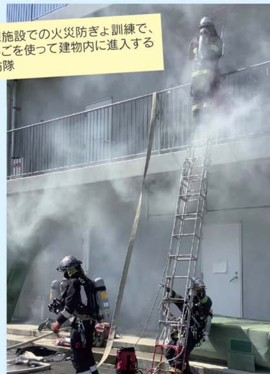
訓練施設での火災防ぎょ訓練で、はしごを使って建物内に入隊する消防隊

日頃から火災に対応するための訓練を実施しています。ホース延長や空気呼吸器の着装などの基本的な訓練や連携訓練などを行い、様々な火災に対応できるようにしています。