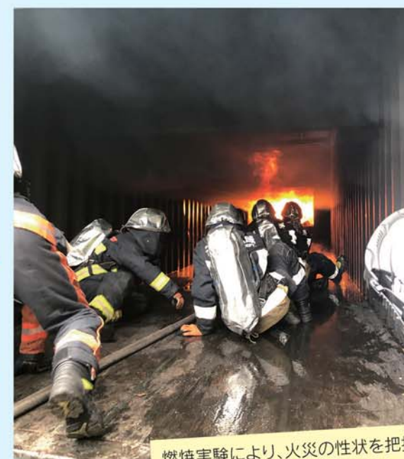
燃焼実験により、火災の性状を把握