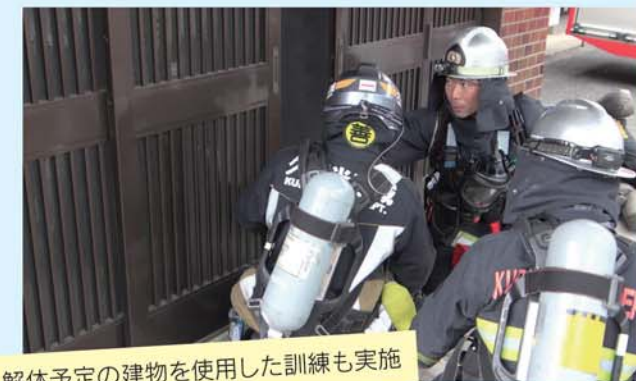
解体予定の建物を使用した訓練も実施