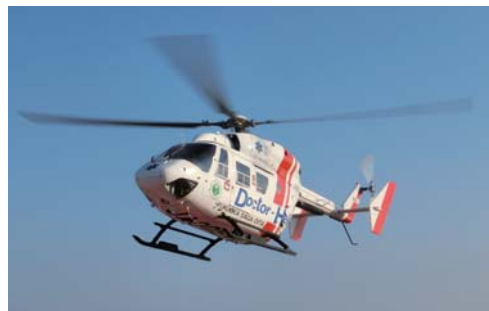
指令センターからの要請を受け出動するドクターヘリ