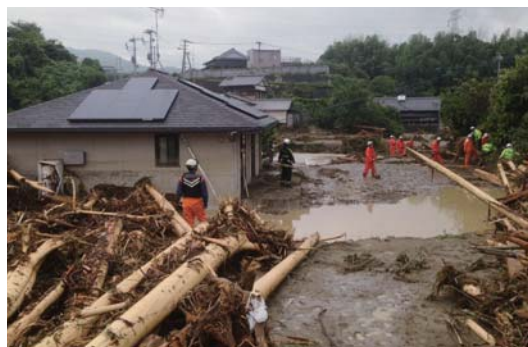
被災地への消防隊や救助隊の迅速な応援が可能に