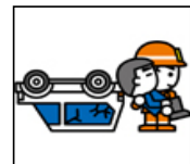
救 助 出場件数 305件 救助人員 323人