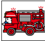
ポンプ車等 ポンプ車 15台 水槽付ポンプ車 10台 指揮車 5台 ホース延長車 4台 資材搬送車 5台