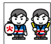
関係団体数 消防設備士会 74事業所 防災協会 1,295事業所 女性防火クラブ 33クラブ 幼年消防クラブ 121団体 少年消防クラブ 3団体