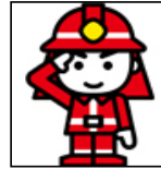
職員数 定数 464人 実員 430人