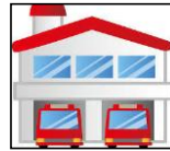
署・所 1本部5署7出張所