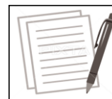
建築同意数 682件 (令和2年度)