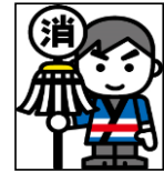
団員数 定員 2,969人 実員 2,774人