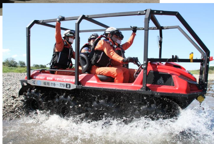
津波・大規模風水害対策車に積載されている「水陸両用バギー」