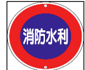
水 利 消火栓 5,191基 防火水槽 1,466基 その他 647基