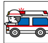
救急車 救急車 20台