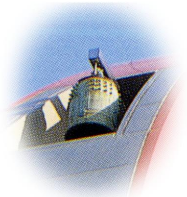
— やすらぎの鐘 —

愛称「やすらぎの鐘」は、消防庁舎のシンボルとして地上高25mの先端に位置し、皆さまの安全を見守り続けています。