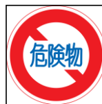
危険物数 製造所 8件 貯蔵所 557件 取扱所 358件