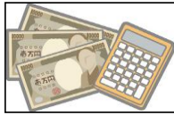
消防予算 49億7千7百万円