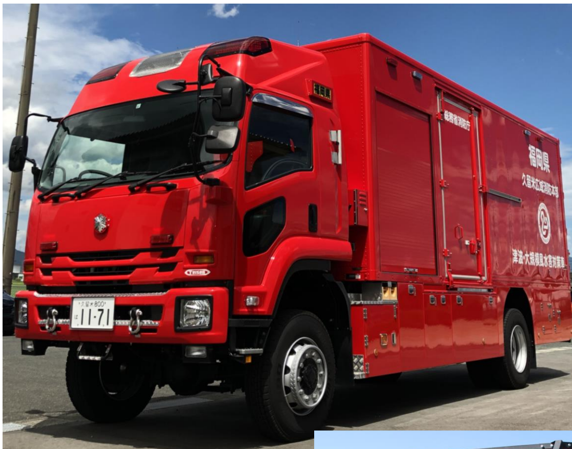
津波・大規模風水害対策車(令和2年8月 納車)