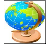
消防本部の位置 東経130° 31' 08" 北緯 33° 19' 13"