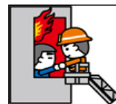
火 災 1位 たき火 15件 2位 電灯・電話等の配線 10件 3位 こんろ 7件