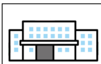
防火対象物数 19,661件 (うち防火管理者が必要な対象物) 3,773件