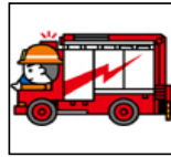
主な特殊車両 化学車 1台 はしご車 4台 救助工作車 6台 大型水槽車 1台 支援車 3台 津波・大規模風水害対策車 1台