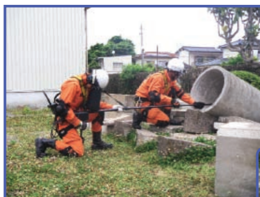
地震により家屋が倒壊、要救助者が取り残されていることを想定し、地中音響探知機による要救助者位置特定、画像探索機による狭小空間内捜索訓練の様子です。

平成23年3月11日に発生した東日本大震災では、緊急消防援助隊 福岡県隊 救助部隊として出動しました。被災地では要救助者捜索・救出活動にあたりました。