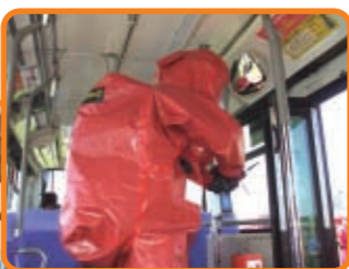
バス内で化学災害が発生したことを想定し、ガス測定器を使用しての車内での検知訓練及び担架を使用した要救助者救出訓練の様子です。